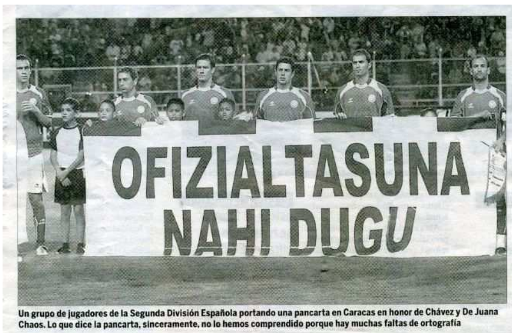
Un grupo de jugadores de la Segunda División Española portando una pancarta en Caracas en honor de Chávez y De Juana Chaos. Lo que dice la pancarta, sinceramente, no lo hemos comprendido porque hay muchas faltas de ortografía

Aquí tienes un ejemplo de manipulación mediática. En la imagen se ve a la selección vasca de fútbol que luce una pancarta en la que se "Ofizialtasuna nahi dugu", que quiere decir queremos la oficialidad, en relación a la negativa recibida a poder presentarse a competiciones oficiales. Obsérvala con detenimiento y valora la información aparecida en prensa. ¿De qué se sirve el periódico para engañar a los lectores? ¿Por qué crees que lo hacen? ¿Qué persiguen?